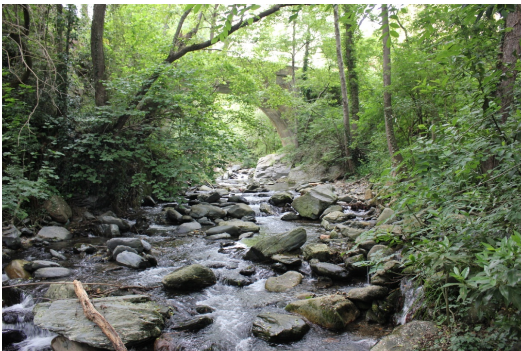
La Tordera (a baix) i un dels seus reguissols al seu pas per Sant Roc ( Prop de la població de Montseny)