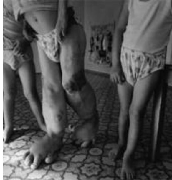
Imatge núm. 8 Els terribles efectes de la radiació en els cossos dels més indefensos.